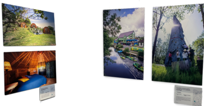
Des projets accompagnés mis en valeur lors d'une exposition photographique

Il permet de soutenir financièrement et techniquement des initiatives locales innovantes, des expérimentations qui contribuent à l'attractivité et au dynamisme des zones rurales. Les acteurs privés comme publics peuvent solliciter un financement pour mener à bien leurs projets. Le programme peut financer aussi bien du fonctionnement que de l'investissement.