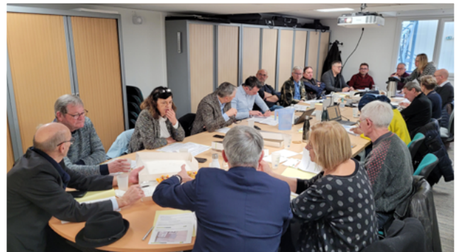
La Commission se réunit à Caen et dans les communes membres (pour des visites de projets)