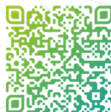
Schéma de cohérence territoriale et aménagement :